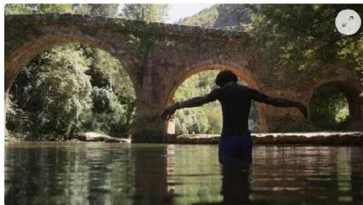
Le Chant des Vivants , de Cécile Allegra | OUEST-FRANCE

📍 Ouest-France Publié le 23/11/2023 à 21h53